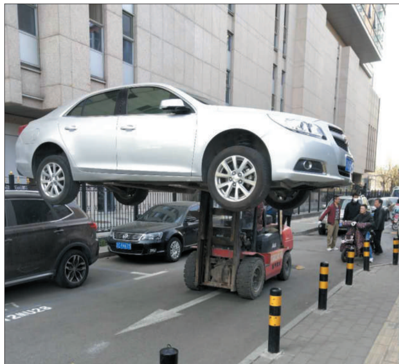
联合执法清理僵尸车。

近日,为确保停车管理办法顺利推行,引导广大辖区居民和社会车辆车主自觉规范停车,街道、社区通过发布公告、倡议书、温馨提示等方式,劝离片区内违停车辆,倡议居民遵守停车管理办法,做到“停车入位”。另外,联合停车管理公司、平房区物业、交管等部门,针对片区内不规范停车现象开展了联合整治行动。